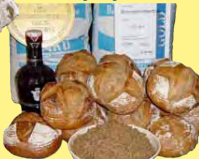
Treberbrot mit Biertreber