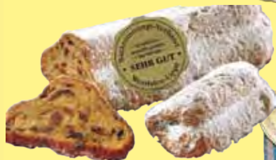
Butterstollen beste Zutaten und alte Handwerkskunst