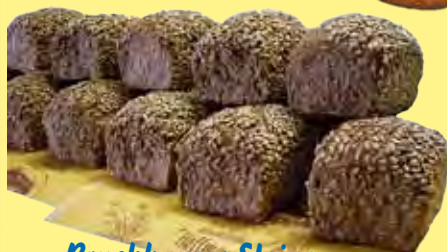
Bruchhauser Steine Mehrkornbrot mit Sonnen- blumenkernen